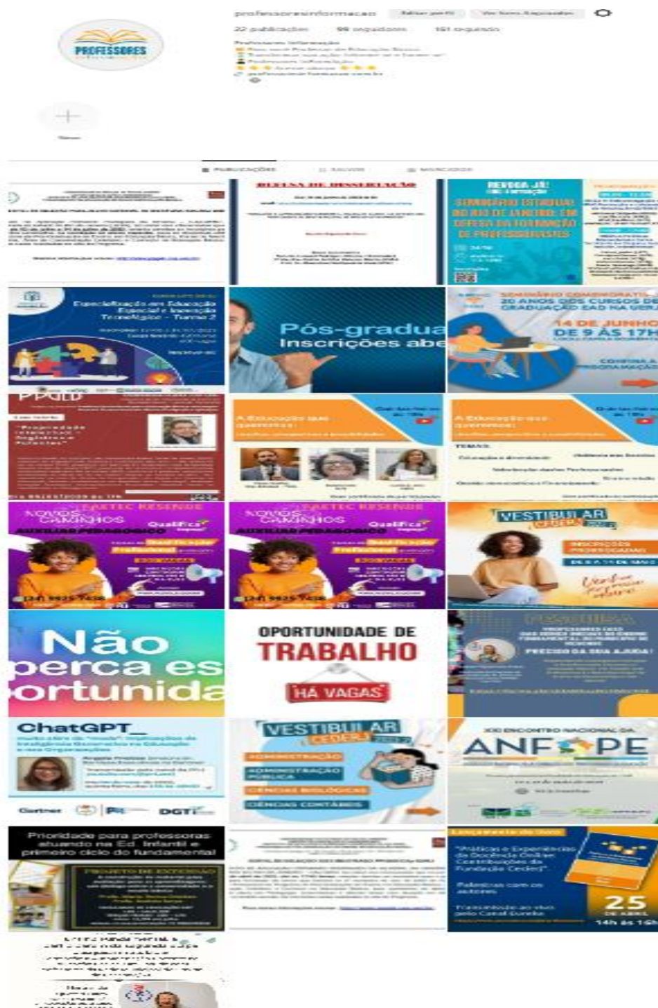
Figura 3: Redes Sociais – Instagram – Professores InFormAção – Fonte: Autora, 2023.

https://www.instagram.com/professoresinformacao/?igshid=MzNINGNkZWQ4Mg%3D%3D