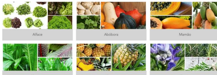
Figura 2 – Título: Trabalhos dos estudantes

Trabalho realizado pela turma de sexto ano do fundamental II, pesquisando as estruturas botânicas de algumas espécies escolhidas para a planta na horta. O resultado da pesquisa dessas imagens, foi feita uma montagem para uso da horta virtual.