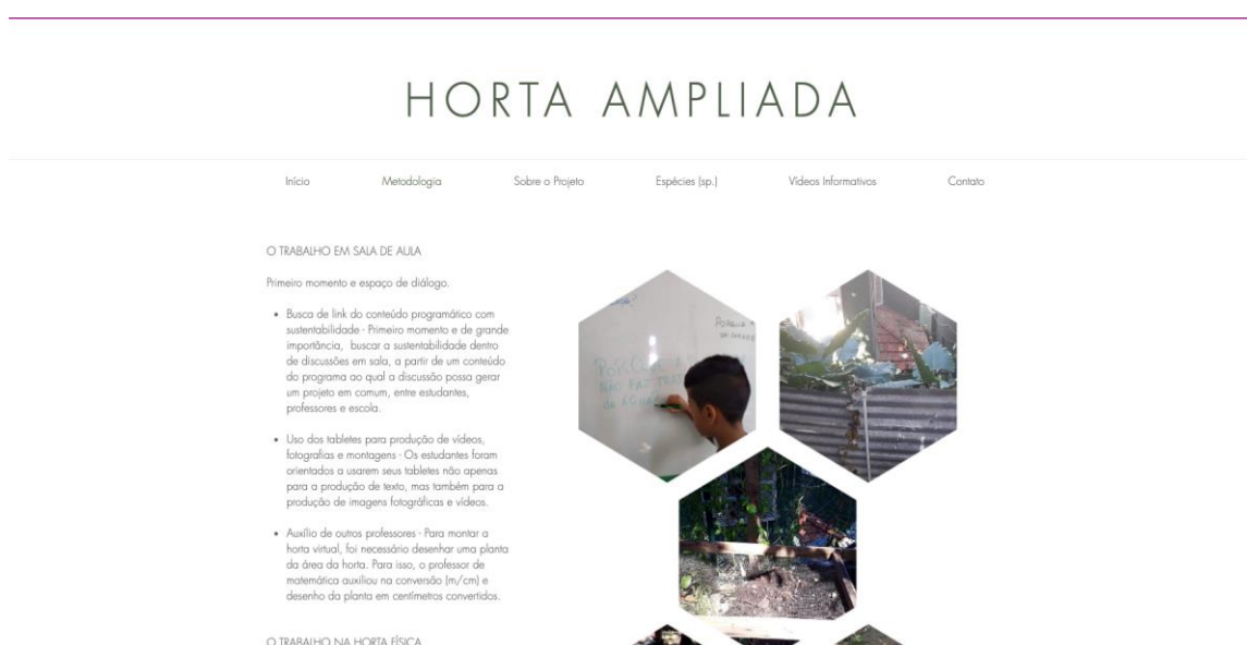
Figura 1 – Título: Trabalhos com as turmas

O conteúdo inclui vídeos de produtores de horta e contatos de lojas para encontrar os insumos necessários para a montagem de hortas, como forma de contribuir com a construção de saberes na área de hortas urbanas.